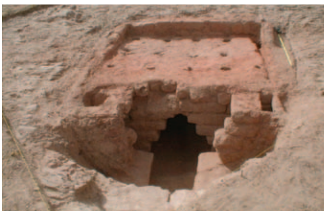
VISTA FRONTAL DO FORNO ROMANO DE SALSELAS

12- Estação do Cabeço da Anta de Salselas, Intervencionada nos anos de 2003 e 2004, com 2 campanhas.