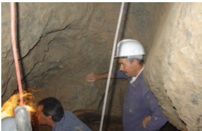
POÇO DE MINERAÇÃO DO BOVINHO

9- Necrópole Medieval do Sobreirinho, intervencionada nos anos de 2003, 2004 e 2006, com 3 campanhas.