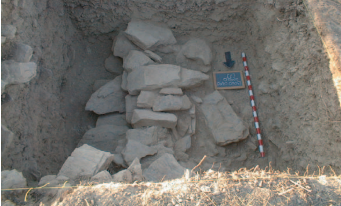
ASPECTO DA MURALHA DA IDADE DO FERRO DO POVOADO DO BOVINHO