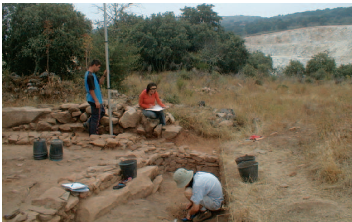
FASE DE TRABALHOS "SECTOR C" DO CRAMANCHÃO