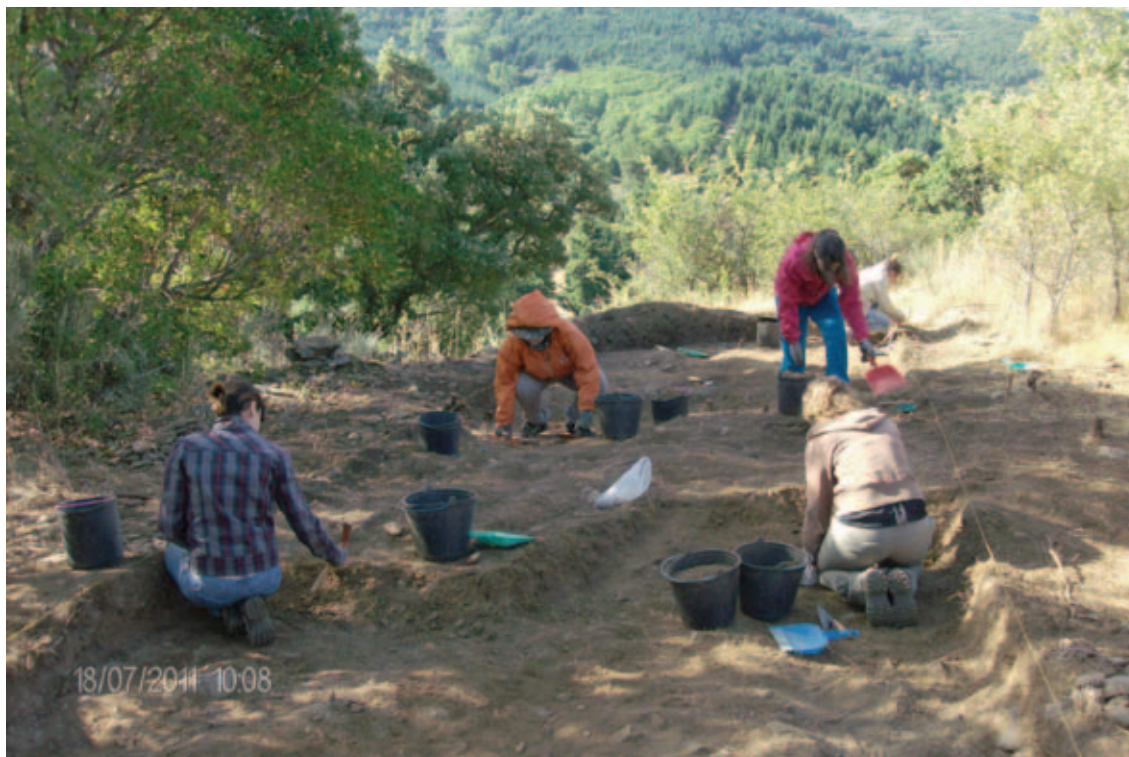
FASE DOS TRABALHOS SECTOR "M" FRAGADOS CORVOS

1 - Fraga dos Corvos, Povoado da 1ª Idade do Bronze, intervenionado desde 2003 até ao ano de 2012, com 10 Campanhas.