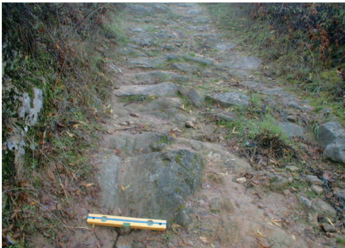
TROÇO DO BUGIO (PARCIAL) DA VIA ROMANA XVII