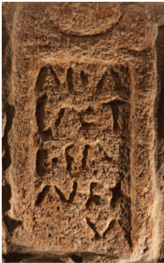
ARA ROMANA ENCONTRADA NUMA CASA PARTICULAR DE PINHOVELO