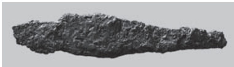
Fig. 5 – Faca afalcatada em ferro do Castro do Outeiro dos Castelos de Beijós.

Outro elemento desta relação precoce com o Mediterrâneo constituem-no os primeiros ferros, peças que têm, igualmente, nas duas Beiras portuguesas a maior concentração do Ocidente Peninsular 36 . Para estes artefactos (Fig. 5), a cronologia dos contextos de proveniência nos sítios de habitat estudados nas duas áreas indicam-nos que poderão situar-se entre os séculos XII a X a.C., aproximando-se das datações mais antigas hoje disponíveis para as primeiras fíbulas de cotovelo peninsulares 37 , pelo que poderão não distar muito, temporalmente, das “fíbulas de enrolamento no arco”. Todos estes elementos corresponderão então ao primeiro momento do “mundo Baiões/Santa Luzia”, com grande probabilidade situado no último quartel do segundo milénio a.C. 38 .