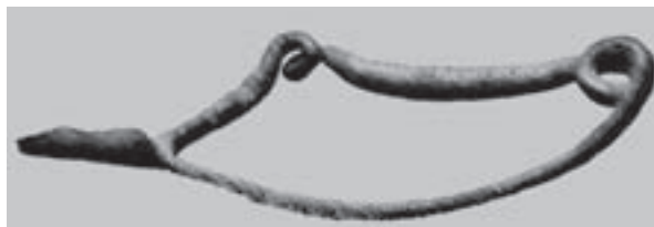
Fig. 3 – Fíbula de Cassibile, Sicília. Musées Royaux d’Art et Histoire, Bruxelles.

Se tivermos em conta que o exemplar da Roça do Casal do Meio foi datado recentemente entre 1004-835 a.C. 35 , o período de utilização de tal tipo de fíbulas na Beira Alta poder-se-ia datar entre o século XII a.C. (una vez que as datações de S. Romão e S. Luzia permitem considerar aí um pico de probabilidade) e o século IX a.C.