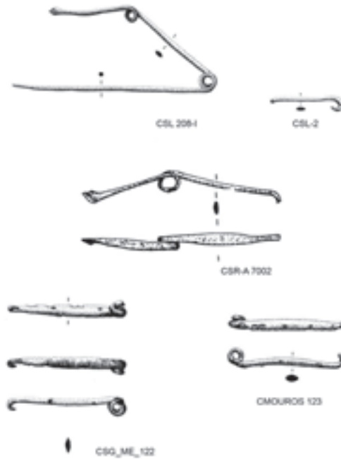
Fig. 4 – Fíbulas de enrolamento no arco do “Mundo Baiões/Santa Luzia”.

As análises composicionais de exemplares de S. Romão e Santa Luzia, tal como os numerosos restos de arames de bronze recuperados no último destes sítios e em Baiões, sugerem produções locais por cópia do modelo original mediterrânico, tal como o que se passa com as peças de cariz atlântico.